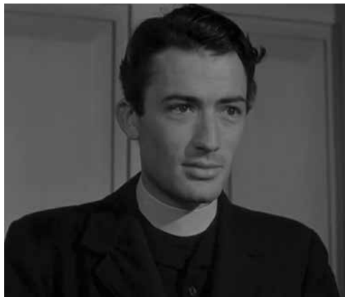
Francisa Chisholma vo filmovom spracovaní Croninovho románu stvárnil Gregory Peck

Ako sa ukázalo, s duchovným otcom Kezerom naozaj nebolo ľahké vyjsť. Bol od prírody popudlivý, náchylný k hrubostiam. To, že sa mu nepodarilo získať náklonnosť svojho stáda, zatvrdilo ho na kameň. Raz síce dostal dobrú faru, ale i tam bol taký neoblúbený, že niekoľko vplyvných ľudí požiadalo biskupa, aby ho preložil. Spočiatku to niesol veľmi ťažko, no neskôr o tom začal hovoriť ako o vlastnom hrdinstve: „Zostúpil som dobrovoľne z trónu na zem...“ Jeho kuchárka a gazdiná slečna Caffertyová jediná s ním vychádzala dobre.