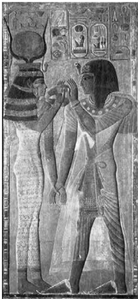
Jozef s manželkou Asenat

Jozefov príbeh svedčí o snahe svätopisca včleniť vieru v jediného Boha do svetového kontextu. Mnohé starozákonné knihy pre podobné zmýšľanie toleranciu nemajú. Skôr v nich vo vzťahu k pohanom badáme netoleranciu. Vykreslenie Jozefovej integrácie do pohanského prostredia má ukázať, že Sväté Písmo má aj prúdy tolerancie voči pohanom a snahy prenikať do neizraelského prostredia.