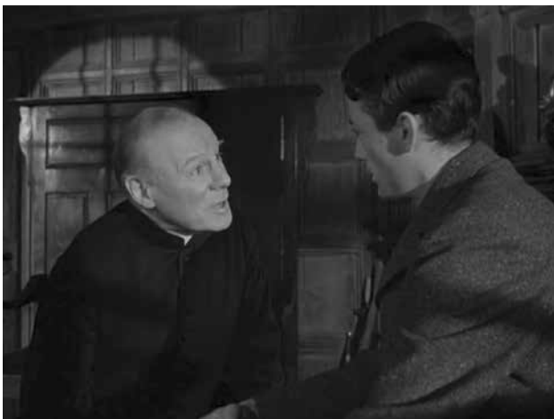
Biskup Mack Nabb vždy veril, že vo svojráznom Francisovi sa ukrývajú nevšedné schopnosti

Francis odišiel do svojej izby, bledý, roztrasený. Mal pred sebou debnu so športovými potrebami, ktorá prišla od priateľa poštou. Teraz už bola nepotrebná, zakázaná. Myslel tuho. Nemôžem sa poddávať, musím bojovať, a to nie za seba, lež za túto ubiedenú farnosť, ktorú mi Boh zveril ako prvý. V nasledujúcich dňoch sa pokúsil ešte vyjednávať s Kezerom, ale čím viac sa o to snažil, tým bol odpor farára neochvejnejší. Vo Francisovi sa však zrodila nová odvážna myšlienka. „Musím to aspoň skúsiť,“ hovoril si.